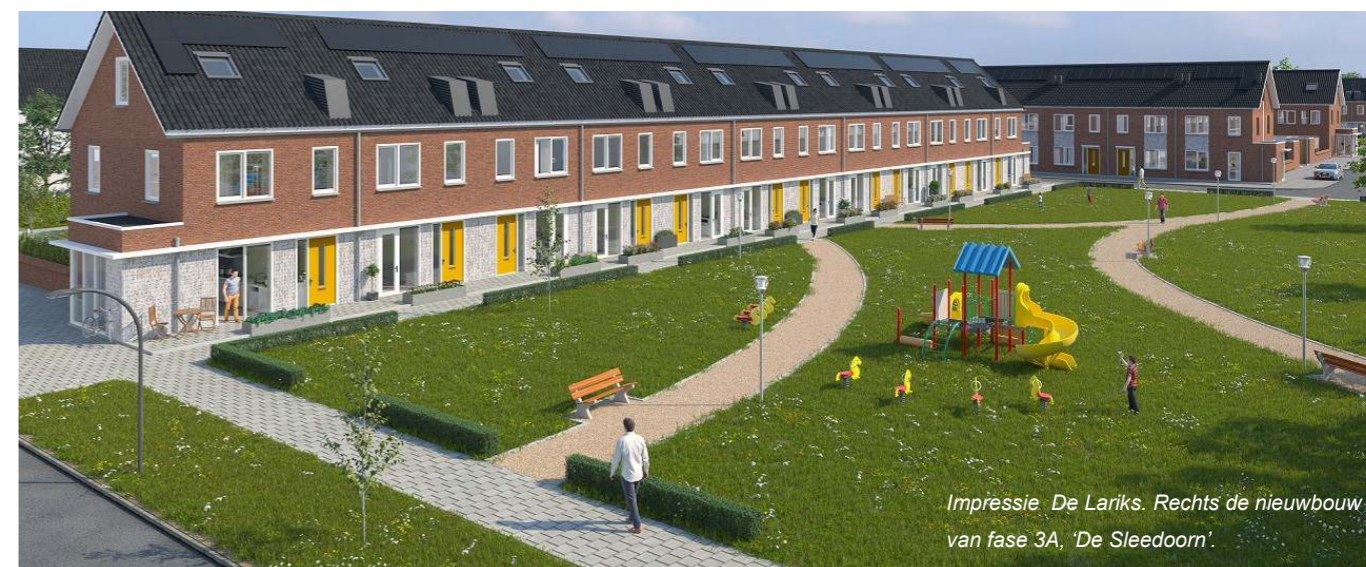
Impressie De Lariks. Rechts de nieuwbouw van fase 3A, 'De Sleedoor'.